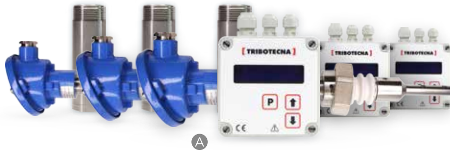
A Sistema de monitoreo de polvo