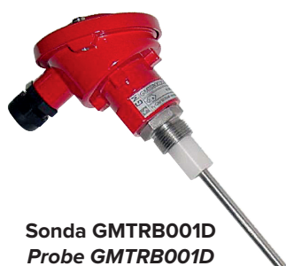
Sonda GMTRB001D Probe GMTRB001D

Graph 1 represents a typical example of display (using the Excel program, installed on an external PC) of the variation of concentration of the dust in function of the time. In abscissa there is the time variable (in this case are minutes), and on the ordinate is placed the dust concentration expressed in mg/ m 3 . In this case is shown a typical trend of the concentration of dust in a system where the filtering is performed in the correct way. The dust concentration amounted to an average value of about 2.3 mg/ m 3 and ranges between a minimum value of 1.75 mg/ m 3 and a maximum value of 3.08 mg/ m 3 .